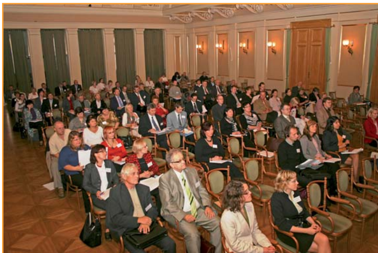
Účastníci konference v brněnském Besedním domě

a vystoupit. Sborník je možné stáhnout na webu JCMM ( http://www.jcmm.cz/cs/konference-prce-s-talentoanou-mlde/sbornk-ppsvk.html ) nebo požádat o tištěnou verzi.