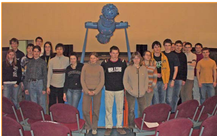
Přednáška na Hvězdárně a planetáriu Mikuláše Koperníka v Brně