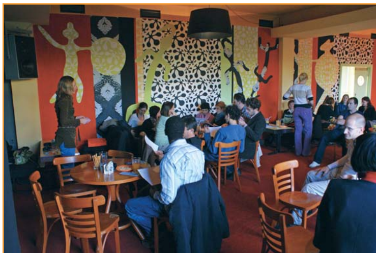
Informační schůzka pro nově přichozí studenty – stipendisty – 17. 10. 2008

Informační schůzka pro nově přichozí stipendisty – 17. 10. 2008.