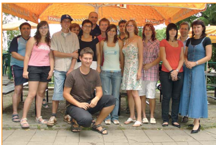
Informační schůzka s rodiči a žáky před odletem do USA

Žáci ze studijní stáže zasílají měsíčně zprávu ze studijního pobytu v USA projektové manažerce JCMM. Po návratu ze studijní stáže pak zpracují závěrečnou zprávu, která bude zveřejněna na webových stránkách JCMM.