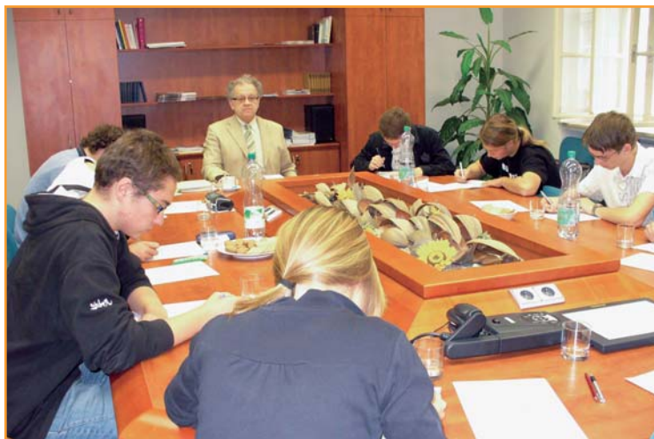
Psychologicko-diagnostické vyšetření nadaných studentů